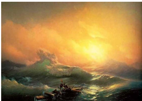
4. Айвазовский «Девятый вал»