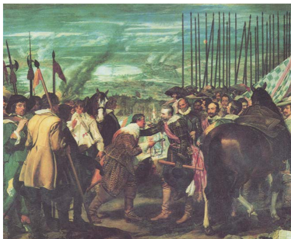
Веласкес «Сдача Бреды»