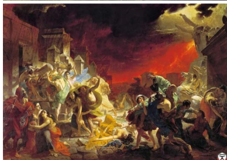
2. Брллов «Последний день Помпеи»