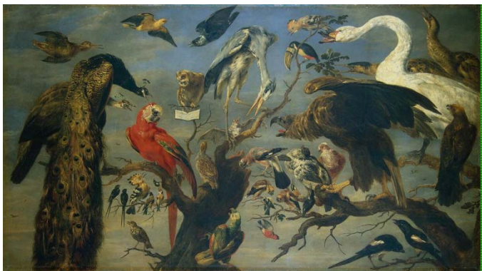
5. Снейдерс «Птичий концерт»